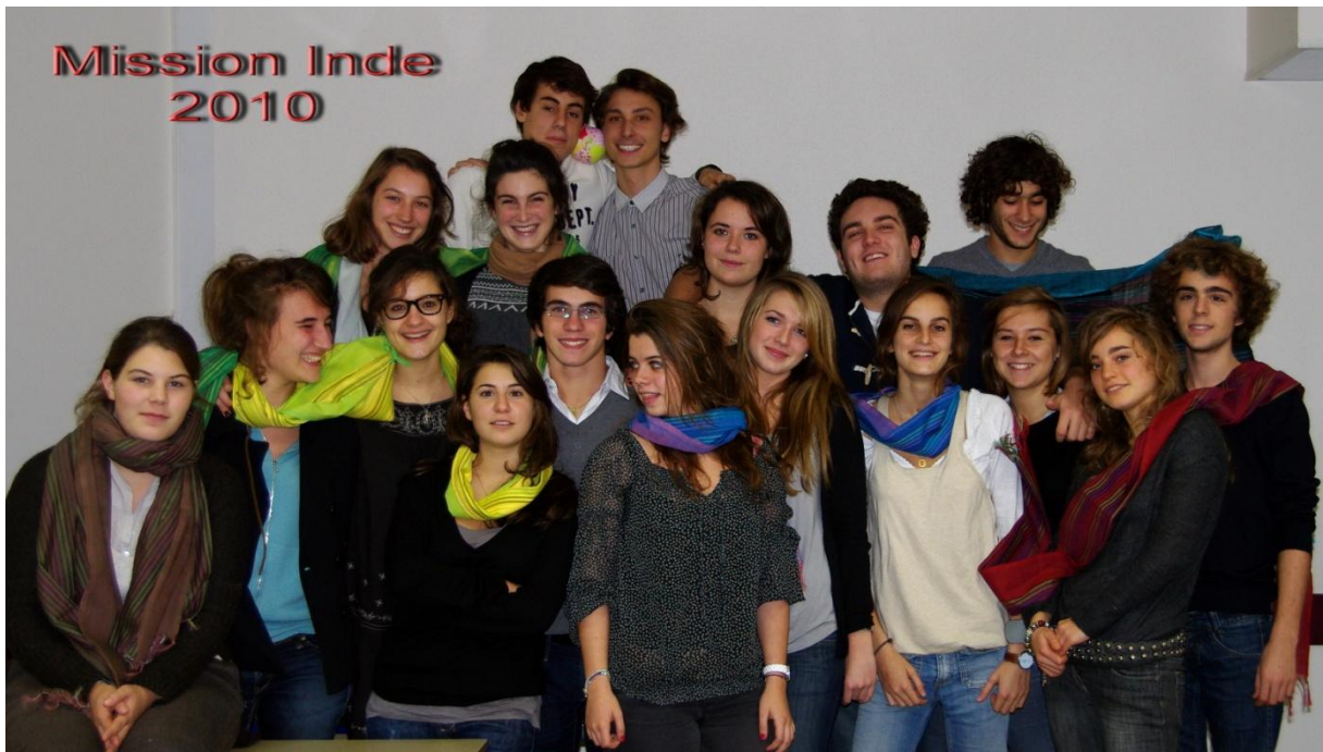
Classes préparatoires Notre Dame du Grandchamp Versailles